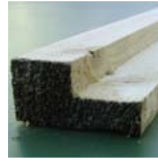
· Wandanschlüsse · Innentürelemente (ohne Abbildung) · Eckpfeiler (ohne Abbildung)