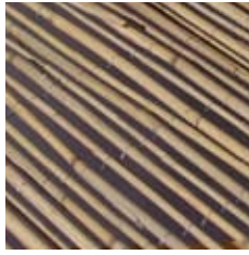
· Putzträgergewebe (Hiss Reet Gewebe)